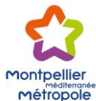
SCHÉMA DIRECTEUR D'ASSAINISSEMENT